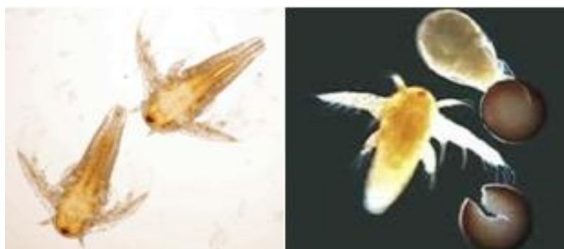
شکل ۱. تفریح (تخم گشایی) Artemia salina . ۲۴ ساعت بعد از اضافه نمودن سیست آرتمیا به انکوپیلاتور، ناپلیوس‌ها از سیست خارج شده و نورگرایی مثبت نشان می دهند.