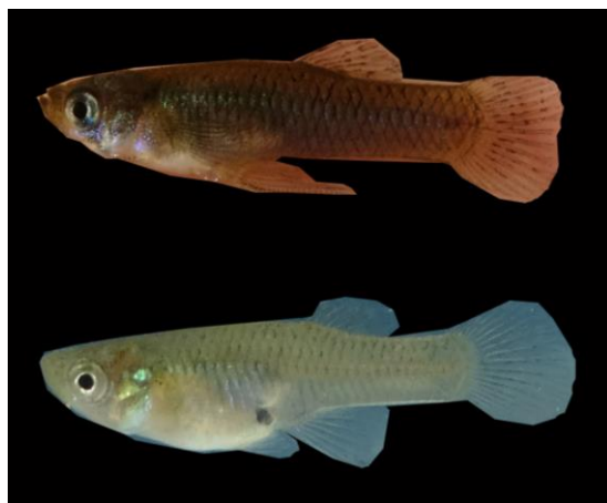
شکل ۳. ماهیان جنس نر و ماده G. holbrooki (تصویر بالا: جنس نر و تصویر پایین: جنس ماده)