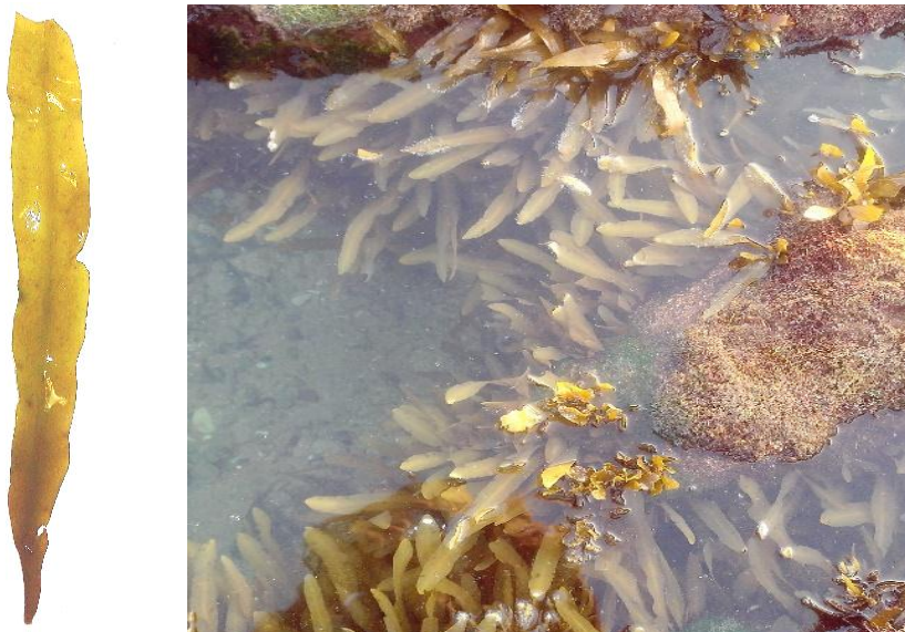
شکل ۱. جلبک قهوه‌ای Nizimuddinina zanardini در زیستگاه طبیعی (سمت راست) و برگ آن (سمت چپ)

تجهیز) تا زمان آنالیز فریز گردید. در این پژوهش استخراج چربی کل در شرایط نور کم و جایگزین سازی هوا با نیتروژن برای جلوگیری از هرگونه تخریب در چربی کل صورت گرفت.