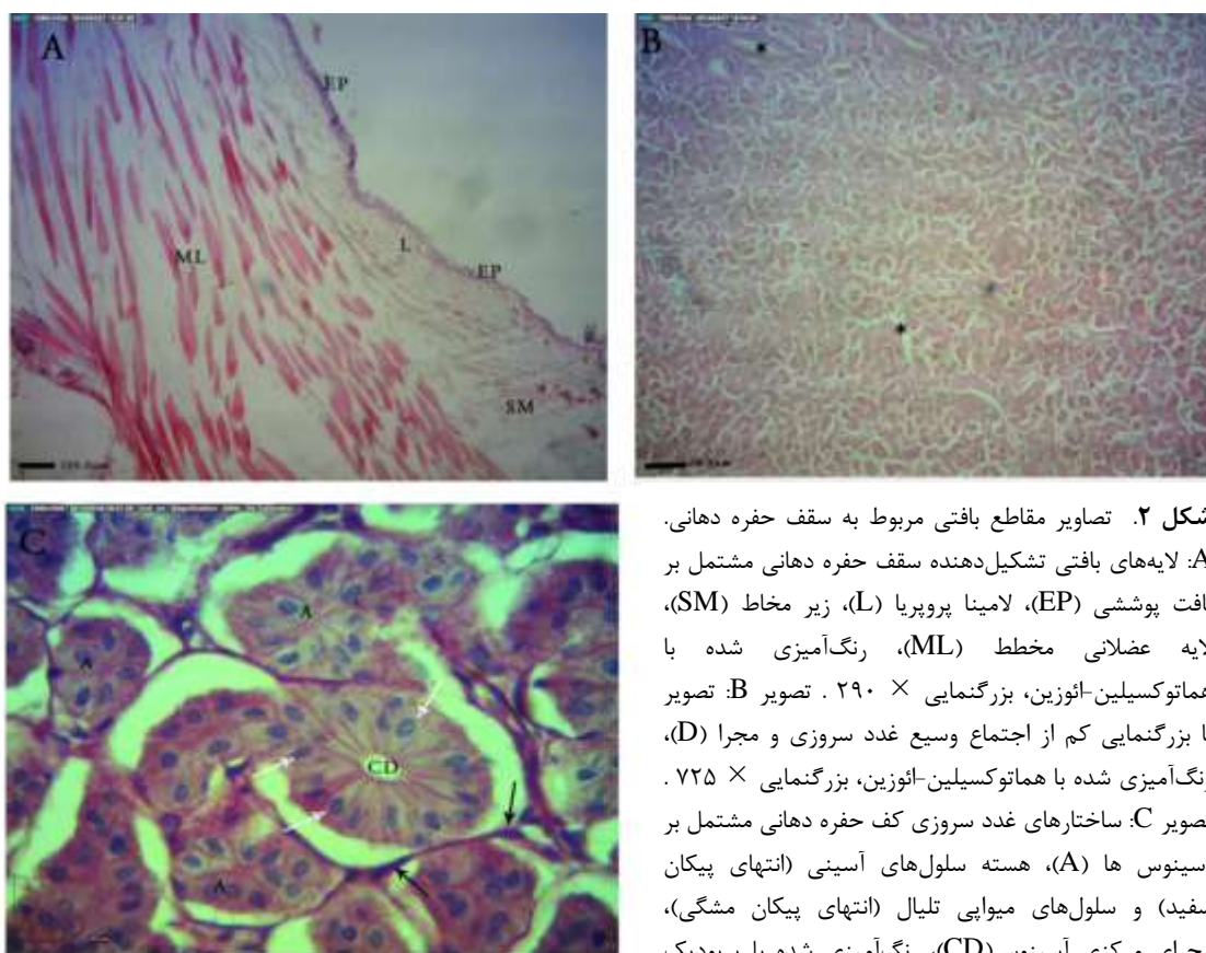
شکل ۲. تصاویر مقاطع بافتی مربوط به سقف حفره دهانی. A: لایه‌های بافتی تشکیل‌دهنده سقف حفره دهانی مشتمل بر بافت پوششی (EP)، لامینا پروپریا (L)، زیر مخاط (SM)، لایه عضلانی مخطط (ML)، رنگ‌آمیزی شده با هماتوکسیلین-ائوزین، بزرگنمایی \times 290 . تصویر B: تصاویر با بزرگنمایی کم از اجتماع وسیع غدد سروزی و مجرا (D)، رنگ‌آمیزی شده با هماتوکسیلین-ائوزین، بزرگنمایی \times 725 . تصویر C: ساختارهای غدد سروزی کف حفره دهانی مشتمل بر آسینوس‌ها (A)، هسته سلول‌های آسینی (انتهای پیکان سفید) و سلول‌های میوایی تلیال (انتهای پیکان مشکی)، مجرای مرکزی آسینوس (CD)، رنگ‌آمیزی شده با پرئودیک اسید-شیف، بزرگنمایی \times 2900 .

ساختار بافتی سقف دهان مشابه کف دهان بود و بافت پوششی از نوع سنگفرشی مطبق شاخی شده بود؛ با این تفاوت که ارتفاع بافت پوششی از ابتدا تا انتها اندازه ثابتی داشت. سلول‌های جامی و ترش‌جی که در ناحیه کف وجود داشت در این قسمت مشاهده نشد. در زیر بافت پوششی، لامینا پروپریا و بعد از آن لایه زیر مخاط قرار داشت و عضله مخاطی مشاهده نگردید. لایه زیر مخاط حاوی عروق خونی فراوان بود، اما ساختارهای غده‌ای مشاهده نشد. بعد از لایه زیر مخاط، طبقه عضلانی مشاهده شد. لایه عضلانی در برخی نواحی وسعت بیشتری پیدا کرده بود (شکل ۲A). پس از لایه عضلانی در فوقانی‌ترین ناحیه سقف دهان تجمع بسیار وسیعی از واحدهای سروزی مشاهده گردید (شکل ۲B). در این واحدها سیتوپلاسم ائوزینوفیلی و هسته‌ها کروی و بازوفیل مشاهده گردید. تعداد سلول‌ها در هر واحد بین ۵-۱۵ سلول مشاهده شد. هسته‌ها هتروکروماتین و در مرکز سلول قرار داشتند. مجرای مرکزی بسیار کوچک بود و به ندرت مشاهده می‌شد (شکل ۲C). در قسمت سقف دهان چین‌های متعددی مشاهده گردید که این چین‌ها در کف حفره دهانی کمتر بودند.