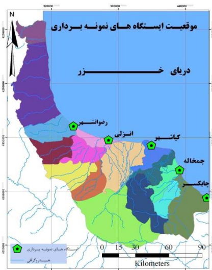
شکل ۱. موقعیت ایستگاه‌های مورد مطالعه در استان گیلان