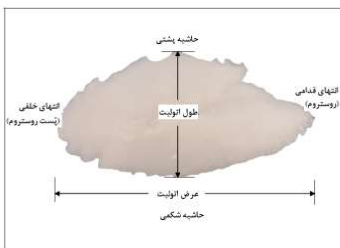
شکل ۱. مشخصات زیست‌سنجی اتولیت در ماهیان (Munk and Smikrud, 2002).