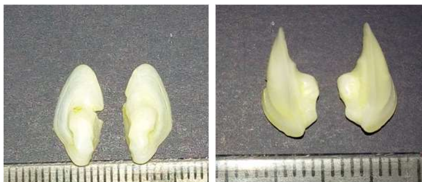
شکل ۳. تصویر اتولیت ماهی شوریده معمولی ( O. ruber )