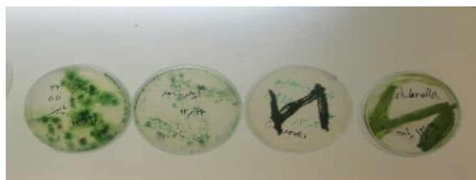
۱ ۲ ۳ ۴

شکل ۲. پلیت ۱ و ۲، حاوی کلنی‌های ناخالص جلبکی، پلیت ۳، خالص از جلبک سبز- آبی تک سلولی، پلیت ۴، خالص از جلبک سبز- آبی رشته‌ای