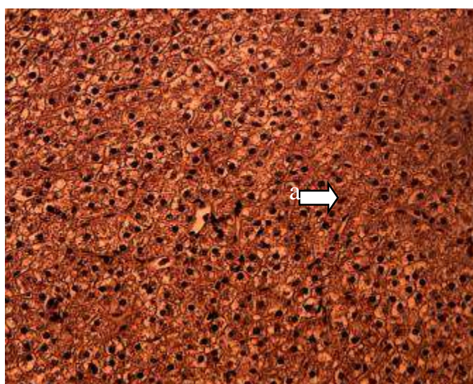
شکل ۳. بافت سالم سلول‌های کبدی گروه شاهد و تیمار تغذیه شده با جیره حاوی ویتامین C در ماهی طلایی -a سلول‌های کبدی (هپاتوسیت‌ها) ( H&E ) (400x)