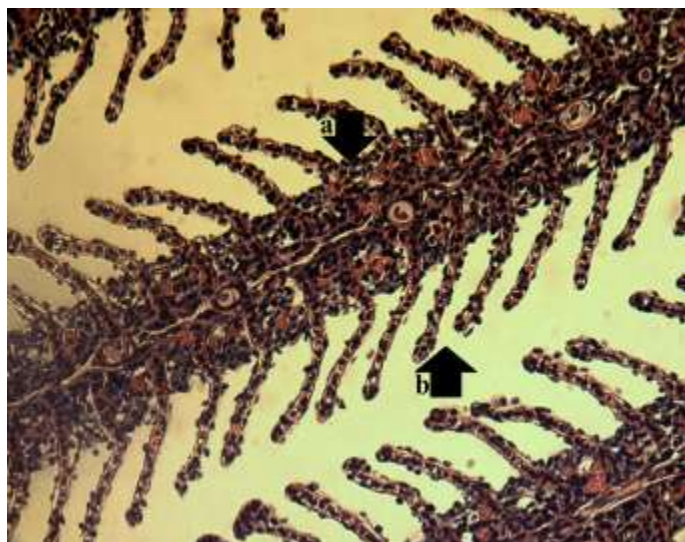
شکل ۱. ساختمان تیغه‌های آبششی گروه شاهد و تیمار تغذیه شده با ویتامین C در ماهی طلایی -a تیغه اولیه، -b تیغه ثانویه، ( H&E ) (400x)