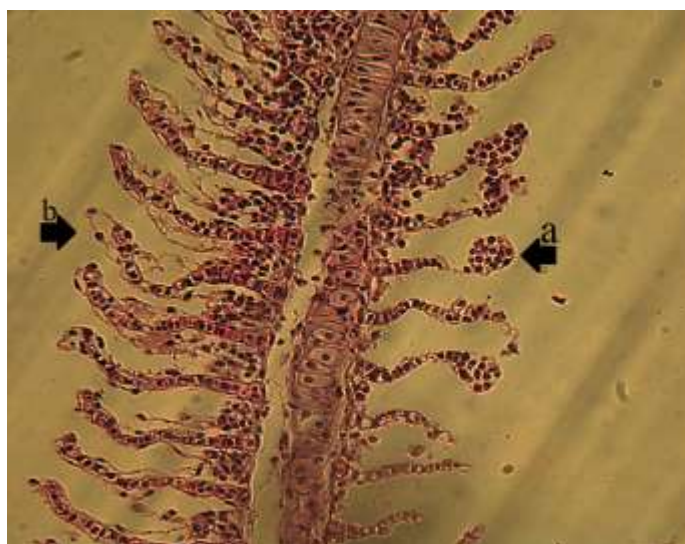
شکل ۲. ساختمان تیغه‌های آبششی تیمار تری کلروفن در ماهی طلایی -a چماقی شدن تیغه‌های ثانویه، -b ادم (H&E 400x)