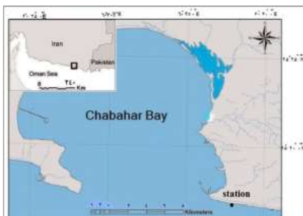
شکل ۱. موقعیت ایستگاه نمونه‌برداری

جهت از بین بردن باکتری‌های آزاد، کیتون‌ها سه بار با آب استریل دریا شسته شدند (Burgess et al. , 2003). پس از کشیدن سوپ استریل به سطح پشتی و شکمی کیتون، سوپ داخل لوله حاوی ۲ سی‌سی آب استریل دریا قرار گرفت؛ سپس ۵ رقت متوالی 10^{-1} تا 10^{-5} از آن تهیه و از هر رقت ۱۰ میکرولیتر روی محیط کشت Zobell Marine Agar (محصول شرکت بیولب، هند) گسترش داده شد. پس از گرمخانه‌گذاری در دمای 37^{\circ} درجه به مدت ۲۴ تا ۴۸ ساعت، کلنی‌های باکتری مشاهده شد. جهت خالص‌سازی باکتری از روش کشت خطی چهار مرحله‌ای استفاده شد. باکتری خالص‌سازی شده در لوله اسلانت زوبل مارین آگار جهت مطالعات بعدی در دمای 4^{\circ} درجه سانتی‌گراد نگهداری گردید (Zheng et al. , 2005).