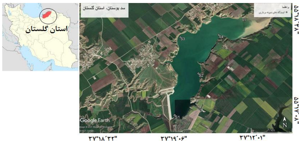
شکل ۱. نقشه ماهواره ای سد بوستان، استان گلستان و موقعیت ایستگاه های نمونه برداری