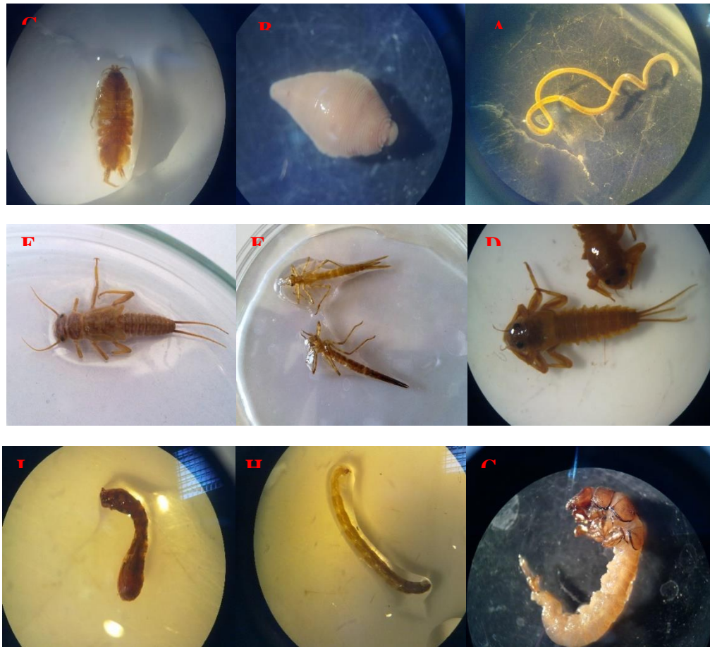
شکل ۲. برخی از کفزیان شناسایی شده در مناطق نمونه برداری از رودخانه زاینده رود.

A: Lumbriculidae, B: Glossiphonidae, C: Asellidae, D: Leptophlebiida, E: Zygoptera, F: Plecoptera, G: Hydropsychidae, H: Chironomidae larvea, I: Simuliidae larvae.