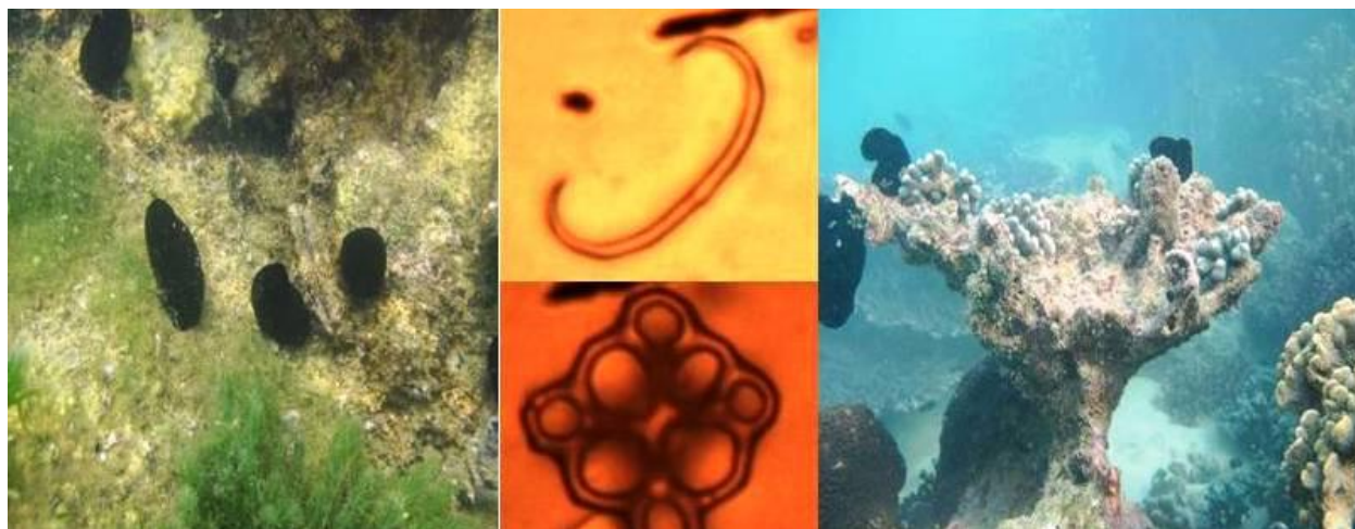
شکل ۲. گونه Phallusia nigra در اطراف جزیره لارک همراه با تصاویر اسپیکول‌های میله ای و جدولی

می‌شوند. سیفون‌ها از هم جدا بوده و دارای ۴ لب می‌باشند (شکل ۳). معمولاً در آبهای عمیق تر از ۱۰ متر روی سنگ‌های مرجانی در جزیره لارک مشاهده می‌شوند.