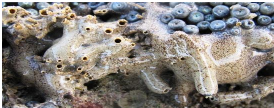
شکل ۴. گونه Didemnum sp.

منتهی می گردند. این ناحیه شامل چندین سیستم زیوه (Zoooid) می باشد (شکل ۵). هر سیستم دارای یک روزنه کلوآکی در مرکز می باشد. جنس دیواره بدن به خصوص در ناحیه سر در این گونه نرم و شفاف با ارتفاع کلونی ۵ سانتی متری می باشد. معمولاً هر کلونی شامل لب های متعددی می باشد. معمولاً هر لب ۵ تا ۸ میلی متر قطر داشته و شامل ۳ سیستم زیوه می باشد. هر لب به وسیله یک پایه مخروطی شکل به ناحیه سر که پهن تر است متصل می گردد. رنگ کلونی در محیط طبیعی، روشن با رگه‌های نارنجی می باشد. سیفون های تنفسی دارای ۶ لب ماهیچه توسعه یافته می باشند.