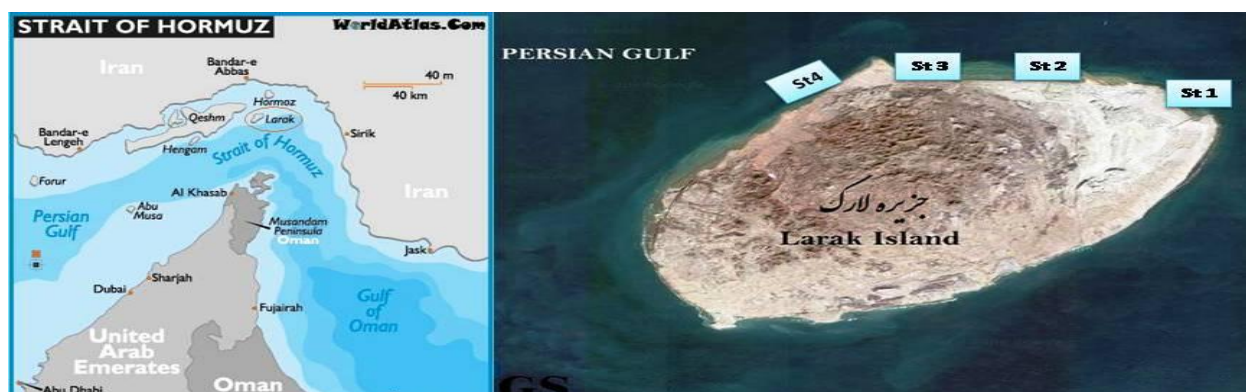
شکل ۱. منطقه مطالعاتی در اطراف جزیره لارک

جهت انجام نمونه برداری، ۴ نقطه در اطراف جزیره لارک مشخص و در هر نقطه ۲ ترانسکت به مساحت ۲۰۰ متر مربع زده شد (شکل ۱). نمونه برداری از طریق عملیات غوازی SCUBA DIVING در اعماق ۵ تا ۱۰ متر صورت گرفت. در هر ایستگاه نمونه ها از ۲ ترانسکت به ابعاد ۱۰×۲۰ متر مربع جمع آوری و موقعیت ترانسکت ها با GPS مشخص گردید. همچنین در هر نمونه برداری از آبفشان های دریایی و محیط پیرامون آنها عکس تهیه گردید. بعد از انتقال نمونه ها به آزمایشگاه از دیواره نمونه ها یک برش کوچک تهیه و پس از استخراج اوسیکل های آهکی (Ossicles)، آنها را روی لام قرار داده و زیر میکروسکوپ از نمونه ها عکسبرداری گردید. شناسایی در حد جنس و گونه و با استفاده از کلیدهای موجود انجام گرفت (Kott, 1985, 1990, 1992, 2001; Monniot et al. , 1991; Monniot and Monniot, 2001). تصاویر تهیه شده جهت شناسایی و تأیید نهایی جنس و گونه به متخصصین مربوطه از جمله پروفیسور Monniot از موزه تاریخ طبیعی پاریس ارسال شد.