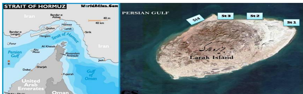
شکل ۱. منطقه مطالعاتی در اطراف جزیره لارک

جهت انجام نمونه برداری، ۴ نقطه در اطراف جزیره لارک مشخص و در هر نقطه ۲ ترانسکت به مساحت ۲۰۰ متر مربع زده شد (شکل ۱). نمونه برداری از طریق عملیات غوازی SCUBA DIVING در اعماق ۵ تا ۱۰ متر صورت گرفت. در هر ایستگاه نمونه ها از ۲ ترانسکت به ابعاد ۱۰×۲۰ متر مربع جمع آوری و موقعیت ترانسکت ها با GPS مشخص گردید. همچنین در هر نمونه برداری از آبفشان های دریایی و محیط پیرامون آنها عکس تهیه گردید. بعد از انتقال نمونه ها به آزمایشگاه از دیواره نمونه ها یک برش کوچک تهیه و پس از استخراج اوسیکل های آهکی (Ossicles)، آنها را روی لام قرار داده و زیر میکروسکوپ از نمونه ها عکسبرداری گردید. شناسایی در حد جنس و گونه و با استفاده از کلیدهای موجود انجام گرفت (Kott, 1985, 1990, 1992, 2001; Monniot et al. , 1991; Monniot and Monniot, 2001). تصاویر تهیه شده جهت شناسایی و تأیید نهایی جنس و گونه به متخصصین مربوطه از جمله پروفسور Monniot از موزه تاریخ طبیعی پاریس ارسال شد.