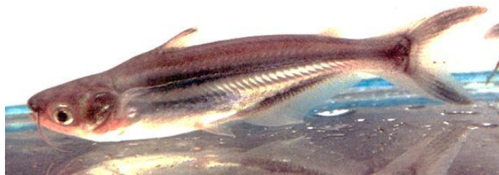
شکل ۱. گربه ماهی پنگوسی Pangasianodon hypophthalmus

گربه ماهی آسیایی گونه ای از خانواده گربه ماهیان با نام علمی Pangasianodon hypophthalmus ، از راسته Siluriformes و خانواده Pangasiidae (www.fishbase.org) می باشد (شکل ۱). این گونه در کشور ما به عنوان ماهی زینتی و در بسیاری از کشورها از جمله کشورهای جنوب شرقی آسیا به عنوان غذا مطرح بوده و دارای ارزش خوراکی با بازار پسنندی بسیار بالا می باشد. گربه ماهی پنگوسی نقش مهمی را در آبی پروری آسیا و صید تجاری ایفا می کند و در کشورهای جنوب شرقی آسیا بخش زیادی از تولیدات آبی پروری را به خود اختصاص می دهد. گونه گربه ماهی پنگوسی گونه آب شیرین بوده و به طور معمول جزو ماهیان سائز بزرگ حاره ای (بیشینه طول ۱۳۰ سانتی متر، www.fishbase.org) است که به بالادست رودخانه برای یافتن مکان تخم ریزی مهاجرت سالیانه انجام می دهد و در دشتهای سیلابی نیز تغذیه می نماید (So et al., 2006). بر اساس بررسی هایی که از کارگاه های پرورش ماهیان زینتی در مراکز عمده تکثیر مصنوعی این گونه در جنوب شرقی آسیا به عمل آمده است، یکی از مشکلاتی که پرورش دهندگان این ماهی زینتی با آن مواجه هستند تلفات زیاد آن خصوصاً در مراحل لاروری و بچه ماهی می باشد که به نظر می رسد به دلیل ضعف در سیستم ایمنی این گونه در سیستم تکثیر و پرورش مصنوعی باشد (Subagja et al., 1999; Elsayed et al., 2006).