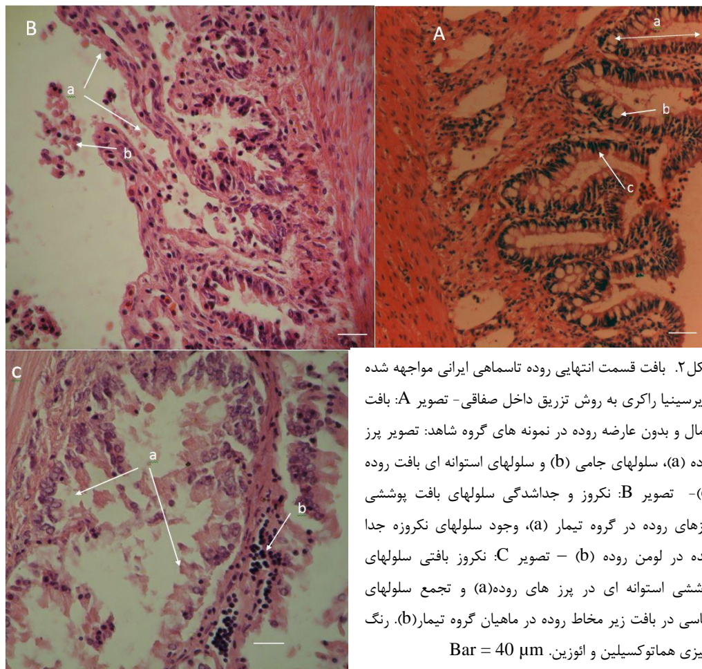
شکل ۲. بافت قسمت انتهایی روده تاسماهی ایرانی مواجهه شده با Yersinia ruckeri با روش تزریق داخل صفاقی - تصویر A: بافت نرمال و بدون عارضه روده در نمونه های گروه شاهد: تصویر پرز روده (a)، سلولهای جامی (b) و سلولهای استوانه ای بافت روده (C) - تصویر B: نکروز و جدانشدگی سلولهای بافت پوششی پرزهای روده در گروه تیمار (a)، وجود سلولهای نکروزه جدا شده در لومن روده (b) - تصویر C: نکروز بافتی سلولهای پوششی استوانه ای در پرز های روده (a) و تجمع سلولهای آماسی در بافت زیر مخاط روده در ماهیان گروه تیمار (b). رنگ آمیزی هماتوکسیلین و اتوزین. Bar = 40 μm