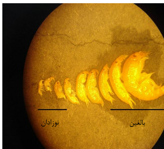
شکل ۱. اندازه‌های مختلف گاماروس پرورشی