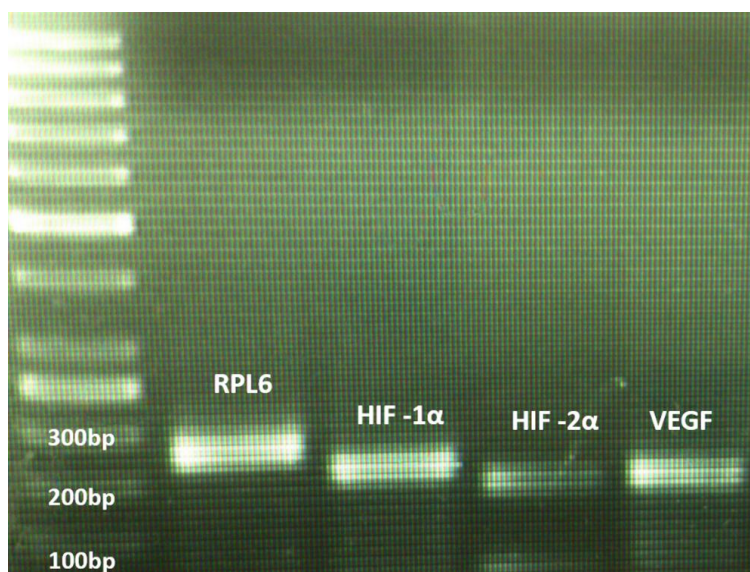
شکل ۱. تصویر محصول PCR روی ژل آگارز ۱٪

با توجه به نتایج این مطالعه، مشخص شد که در معرض قرارگیری با اندوسولفان می تواند باعث افزایش معنی دار بیان نسبی ژن VEGF در بافت آبشش تاسماهی ایرانی شود ( P < 0/05 ) به طوری که بیشترین تغییرات هم در روزهای ۷ و ۱۴ قابل مشاهده است، البته بین تیمارهای در معرض قرار گرفته با اندوسولفان اختلاف معنی داری وجود نداشت. همچنین در ژن های HIF-1 \alpha و HIF-2 \alpha نیز بیان نسبی در مقایسه با گروه کنترل افزایش یافت. مقایسه بین تیمارهای در معرض قرار گرفته با آفت کش در ژن HIF-1 \alpha نشان داد بیشترین بیان ژن در بیشترین غلظت سم اتفاق افتاده و این اختلاف در چهار زمان نمونه برداری نیز ادامه دارد ( P < 0/05 ) ولی بین تیمارهای ۱۰ و ۲۰ میکروگرم در لیتر، در روزهای اول و چهاردهم اختلاف معنی داری وجود نداشت. نتایج نشان داد در روز دوم و چهاردهم میزان بیان ژن HIF-2 \alpha در غلظت ۴۰ میکروگرم در لیتر به طور معنی داری بیشتر از سایر گروه های در معرض قرار گرفته با سم است.