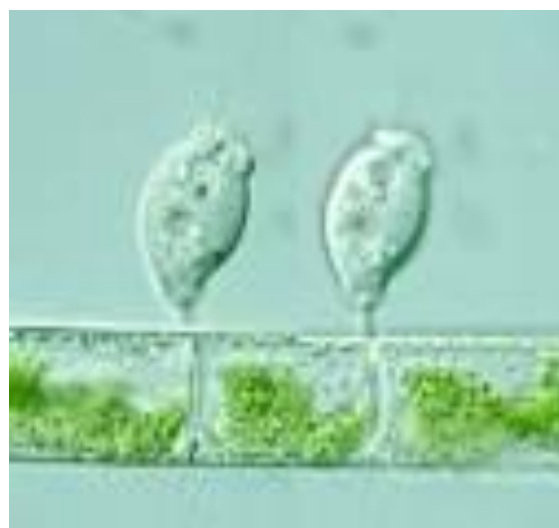
شکل ۳. E. rahbditostyla روی رشته اسپروژیر