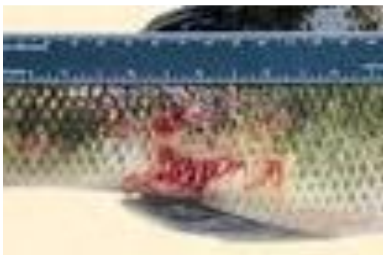
شکل ۶. زخم برجا مانده (Red Sore) از کلنی اپیستی لیس روی بدن ماهی