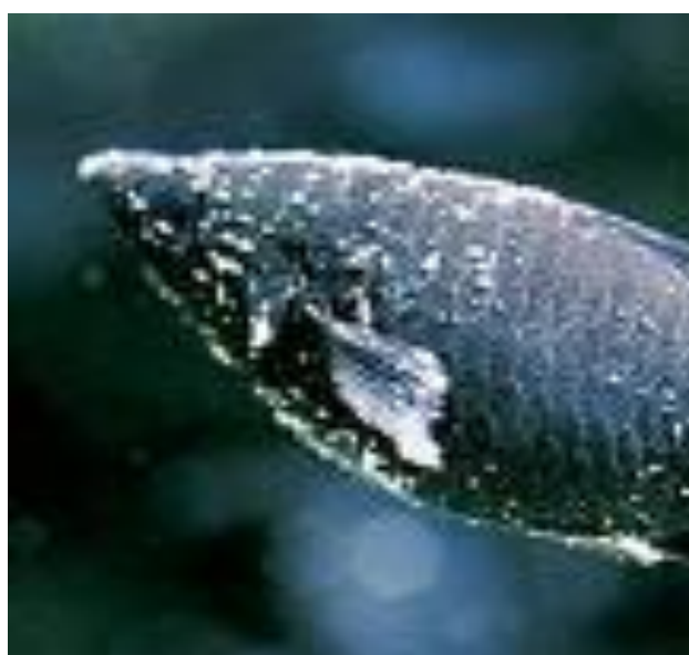
شکل ۵. Apiosoma ( Glossatella ) Sp. در سطح بدن ماهی