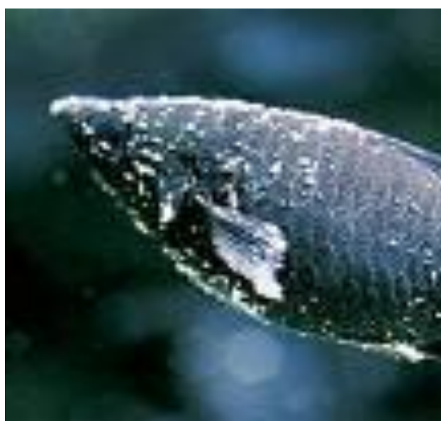
شکل ۵. Apiosoma ( Glossatella ) Sp. در سطح بدن ماهی