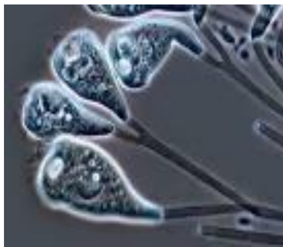
شکل ۲. اپیستی لیس پلیکا تا ( E. plicata )