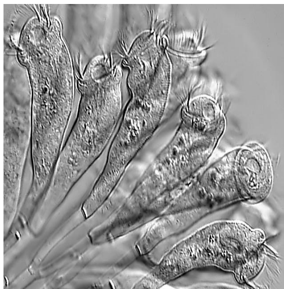
شکل ۱. اپیستی لیس زیر میکروسکوپ فاز متضاد