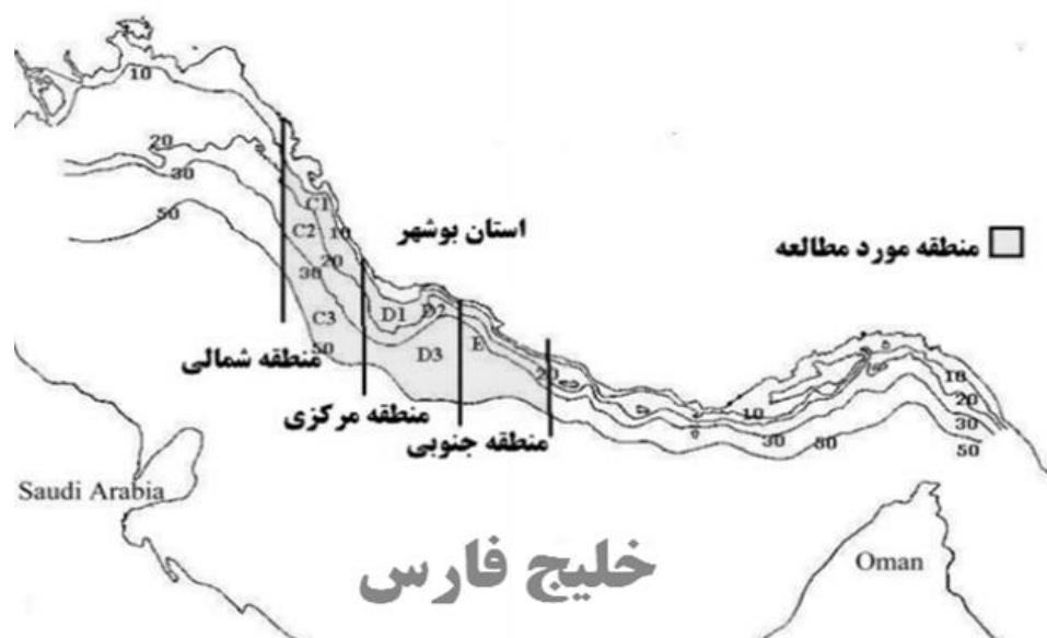
شکل ۱. موقعیت جغرافیایی منطقه مورد مطالعه در طول سواحل استان بوشهر (بهمن ۱۳۹۰)

برای جمع‌آوری داده‌ها طرح تصادفی طبقه‌بندی شده (Stratified random sampling) مورد استفاده قرار گرفت (Sparre and Venema, 1992). در این تحقیق از کشتی ترال فردوس ۱ استفاده شد. ابزار صید و نمونه‌برداری در این تحقیق یک تور ترال کف روب بود. خصوصیات تور ترال مورد استفاده در جدول ۲ آورده شده است.