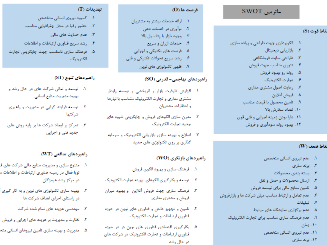
شکل ۴. ماتریس سوات ارزیابی عملکرد شرکت‌های فناوری و نوپا فعال در زمینه فروش آنلاین آبزبان مستقر در مرکز رشد هرمزگان

مدل سوات ماهیت استراتژیک شرکت‌های فناوری و نوپا فعال در زمینه فروش آنلاین آبزبان مستقر در مرکز رشد هرمزگان را بر اساس عوامل داخلی و خارجی مهم شناسایی شده که در واقع فهرست نقاط قوت و ضعف و فرصت‌ها و تهدیدها می‌باشند، تدوین می‌کند.