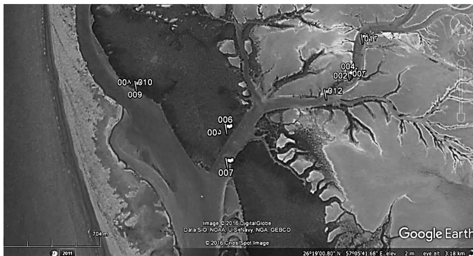
شکل ۲. موقعیت رویشگاه و توزیع نقاط مورد بازدید و نمونه‌برداری (نقاط شماره ۰۶، ۰۷ و ۰۹)

میلی‌لیتری و افزودن ۴۰۰ میکرولیتر ایزوپروپانول سرد انجام شد و به مدت ۲۰ دقیقه نمونه‌ها در یخچال با دمای ۲۰- درجه قرار داده شد. بعد از آن به مدت ۱۰ دقیقه با ۱۵۰۰۰ دور در دستگاه سانتریفیوژ قرار گرفتند. پس از آن مایع موجود در تیوپ به آرامی از آن دور ریخته می‌شود. سپس ۴۰۰ میکرولیتر الکل اتانول ۷۰ درصد به هر تیوپ اضافه گردیده و با ۱۳۰۰g برای مدت ۵ دقیقه در سانتریفیوژ قرار گرفتند. این مرحله از کار جهت شست و شو انجام گرفت. اتانول را از تیوپ‌ها دور ریخته و تیوپ‌های حاوی کلاف در ته تیوپ‌ها به حالت وارونه روی دستمال نم‌گیر به مدت دو ساعت قرار داده تا اتانول باقی‌مانده از آن کامل تبخیر شده و در انتها مقدار ۱۰۰ میکرولیتر آب مقطر تزریقی به هر تیوپ اضافه شده و در یخچال ۲۰- قرار داده شد. به‌منظور بررسی حضور، ارزیابی خلوص و تعیین غلظت DNA استخراج شده به‌ترتیب از دستگاه نانودرآپ و الکتروفورز روی ژل یک درصد آگارز استفاده شد (Sambrook et al. , 1989).