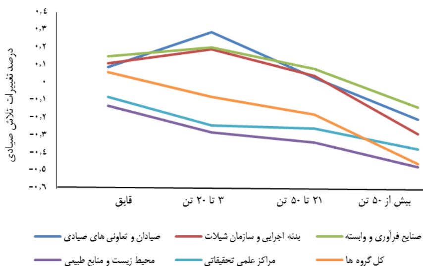
شکل ۲. نتایج تغییرات تلاش صیادی به تفکیک ناوگان در سناریوی بلندمدت

همان‌گونه که مشخص است، بر اساس شکل ۲، برنامه‌ریزی آرمانی توانسته است توازن مناسبی میان درصد به‌کارگیری از شناورهای مختلف جهت صید میگو در گروه‌های مختلف ذینفع ایجاد نماید. این مسئله با نگاه به حرکت رنگ نارنجی (تغییرات در تعداد شناورها به‌صورت درصدی در حالت کلی) در میان طیف‌های رنگی دیگر قابل مشاهده است و به‌نوعی این درصدها،