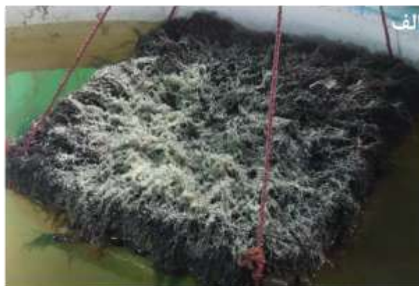
شکل ۱. لانه‌های حاوی تخم ماهی سوف در تحقیق حاضر. لانه طبیعی (الف)، لانه مصنوعی (ب).