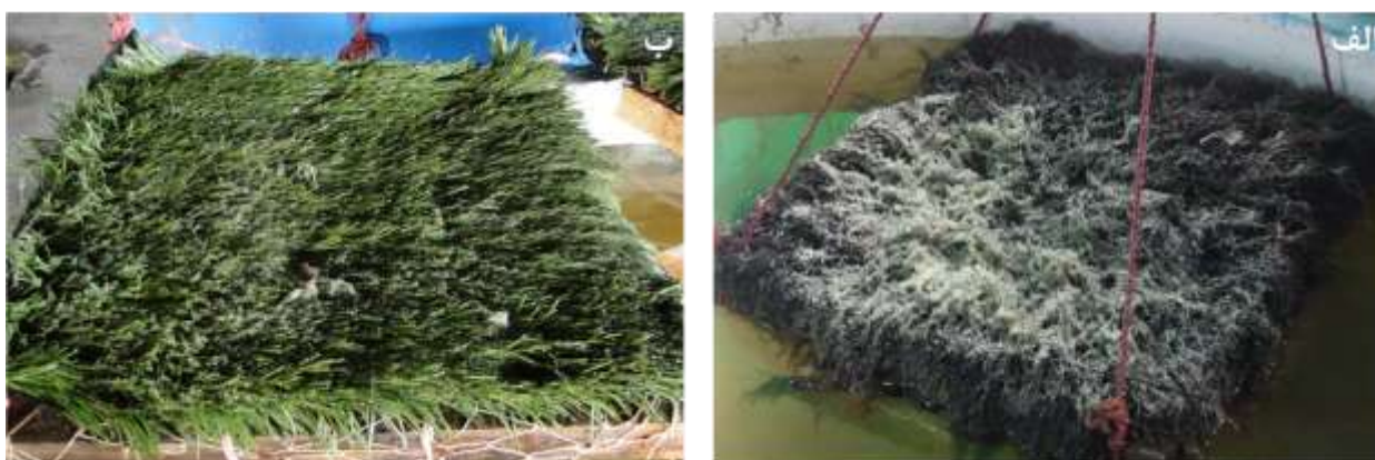
شکل ۱. لانه‌های حاوی تخم ماهی سوف در تحقیق حاضر. لانه طبیعی (الف)، لانه مصنوعی (ب).

ماهی سوف از هر دو نوع بستر برای تخم‌ریزی استفاده نمود (شکل ۱). در طی مدت آزمایش مجموعاً از ۱۰۴ ماهی تعداد ۸۶ عدد از آن‌ها تخم‌ریزی نموده و در مجموع ۸۲/۷ درصد از ماهیان موفق به تخم‌ریزی شدند. نتایج مربوط به اثر نوع بستر و دمای آب بر درصد موفقیت تخم‌ریزی، درصد لانه‌های حاوی تخم و درصد لقاح در جدول ۱ ارائه شده است. اثر متقابل نوع بستر و دما در هیچ‌یک از پارامترهای اندازه‌گیری شده معنی‌دار نبود ( p>0.05 ). در دمای بالاتر تعداد بیشتری از نرها در تخم‌ریزی و تولیدمثل مشارکت داشتند ( p<0.05 ). این مورد در ماهیان ماده نیز مشاهده شد اما اختلاف معنی‌دار نبود ( p>0.05 ). درصد موفقیت تخم‌ریزی و لانه‌های حاوی تخم در دمای بالاتر نسبت به دمای پایین بیشتر بود اما اختلافی در درصد لقاح بین دماها و بسترهای مختلف مشاهده نشد. در زمان تخم‌ریزی نیز اختلافی بین بسترها و دماهای مختلف مشاهده نشد، گو اینکه مدت زمان جواب‌دهی مولدین در دمای ۱۱ درجه سانتی‌گراد در حدود ۷-۴ روز و در دمای ۱۲/۶ درجه سانتی‌گراد در محدوده ۴-۳ روز ثبت گردید. در مقایسه دو تیمار به صورت جداگانه، اختلافی در خصوص درصد موفقیت تخم‌ریزی و لقاح بین دو نوع لانه دیده نشد (شکل ۲ الف و ب)، اما این اختلاف در دو دمای متفاوت مشاهده شد، به طوری که بیشترین موفقیت تخم‌ریزی ( 4/2 \pm 89/6 ) در دمای بالاتر ثبت گردید (شکل ۳ الف). همچنین درصد لقاح، اختلافی را بین دو دما نشان نداد (شکل ۳ ب).