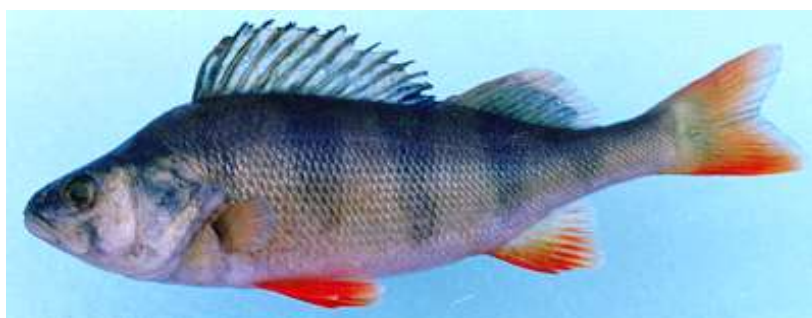
شکل ۱. نمای جانبی از سوف رودخانه‌ای Perca fluviatilis صید شده از تالاب انزلی.

با توجه به این‌که این گونه دارای پراکنش متوسط اما جمعیت ناچیزی می‌باشد (Abbasi, 2007)، این مطالعه به منظور مقایسه خصوصیات اندازه‌شی و شمارشی سوف رودخانه‌ای در دو زیستگاه تالاب انزلی در غرب و مصب رودخانه چمخاله در شرق استان گیلان، که بیش از ۸۰ کیلومتر از یکدیگر فاصله دارند، به منظور تفکیک جمعیتی آن در مطالعات آتی از جمله حفاظت و تکثیر مصنوعی انجام شد.