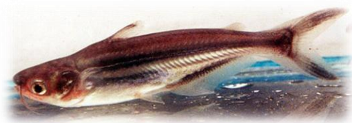
شکل ۱. گره ماهی پنگوسی Pangasianodon hypophthalmus

گره ماهی آسیایی گونه‌ای از خانواده گره ماهیان با نام علمی Pangasianodon hypophthalmus ، از راسته Siluriformes و خانواده Pangasiidae (www.fishbase.org) می‌باشد (شکل ۱). این گونه در کشور ما به عنوان ماهی زینتی و در بسیاری از کشورها از جمله کشورهای جنوب شرقی آسیا به عنوان غذا مطرح بوده و دارای ارزش خوراکی با بازار پسندی بسیار بالا می‌باشد. گره ماهی پنگوسی نقش مهمی را در آبی پروری آسیا و صید تجاری ایفا می‌کند و در کشورهای جنوب شرقی آسیا بخش زیادی از تولیدات آبی پروری را به خود اختصاص می‌دهد. گونه گره ماهی پنگوسی گونه آب شیرین بوده و به طور معمول جزو ماهیان سایز بزرگ حاره ای است که به بالادست رودخانه برای یافتن مکان تخم ریزی مهاجرت سالیانه انجام می‌دهد و در دشتهای سیلابی نیز تغذیه می‌نماید (So et al., 2006). بر اساس بررسی‌هایی که از کارگاه‌های پرورش ماهیان زینتی به عمل آمده است، یکی از مشکلاتی که پرورش دهندگان این ماهی زینتی با آن مواجه هستند تلفات زیاد آن خصوصاً در مراحل لاروری و بچه ماهی می‌باشد که به نظر می‌رسد به دلیل ضعف در سیستم ایمنی این گونه در سیستم تکثیر و پرورش مصنوعی باشد.