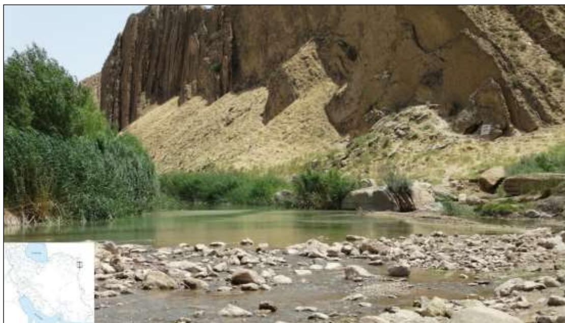
شکل ۱. رودخانه هریرود، زیستگاه زردپَر سرمخروطی L. conocephalus . مرز بین دو کشور ایران و ترکمنستان.

آنالیز داده‌ها: توالی‌ها با استفاده از نرم‌افزار Geneious Prime 2020 ویرایش شدند. عملیات یکپارچگی توالی‌های ژن COI با استفاده از CLUSTALW در نرم‌افزار Bioedit انجام شد (Hall et al. , 2011). به منظور یافتن توالی‌های مشابه جهت ترسیم درخت تبارشناسی، توالی ویرایش شده با استفاده از جستجوی BLAST در بانک جهانی NCBI با سایر توالی‌های این جنس مقایسه شدند. مدل تجزیه و تحلیل با استفاده از نرم‌افزار MrModeltest2 انتخاب شد (Nylander, 2004). بر اساس نتیجه حاصله از این نرم‌افزار، مدل K2+G برای تجزیه و تحلیل پیشنهاد شد. برای ترسیم درخت‌های تبارشناسی از روش inference Bayesian در نرم‌افزار MrBayes v. 3.2 (Ronquist et al. , 2012) و تکرار ۱۰ میلیون نسل و برای Maximum likelihood از نرم‌افزار RaxML GUI v. 2.0 (Edler et al. , 2021) و ۱۰ هزار تکرار استفاده شد. برای تعیین فاصله نوکلئوتیدی توالی‌های حاصل از روش K2P در نرم‌افزار MEGA v. 7.0 استفاده شد (Kumar et al. , 2016). همچنین برای ترسیم درخت‌های به دست آمده نیز از نرم‌افزار FigTree v. 1.5 استفاده گردید (Rambaut, 2009). گونه Cyprinus carpio نیز به عنوان برون گروه در نظر گرفته شد.