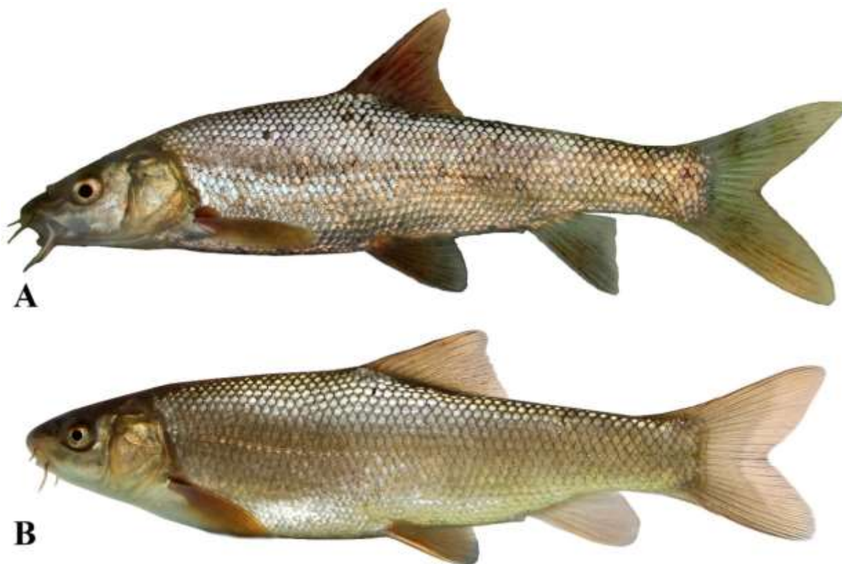
شکل ۲. A: زردپر سرمخروطی Luciobarbus conocephalus ، صید شده از رودخانه هریرود، پل خاتون، خراسان رضوی؛ B: سیاه ماهی هراتی Capoeta heratensis ، صید شده از رودخانه کلات، خراسان رضوی