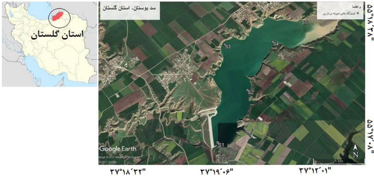
شکل ۱. نقشه ماهواره ای سد بوستان، استان گلستان و موقعیت ایستگاه های نمونه برداری