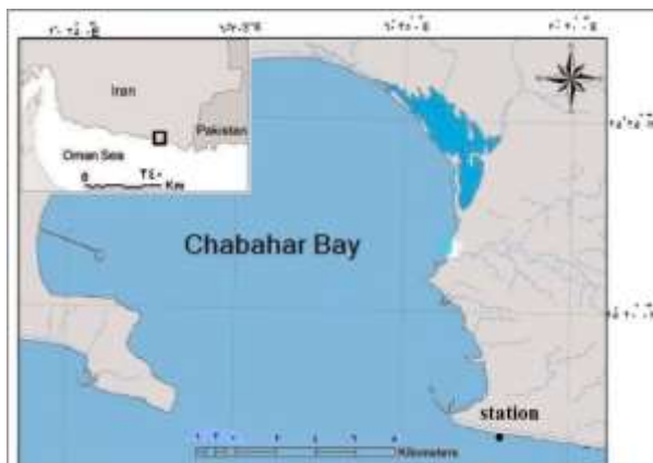
شکل ۱. موقعیت ایستگاه نمونه‌برداری

جهت از بین بردن باکتری‌های آزاد، کیتون‌ها سه بار با آب استریل دریا شسته شدند (Burgess et al. , 2003). پس از کشیدن سوپ استریل به سطح پشتی و شکمی کیتون، سوپ داخل لوله حاوی ۲ سی‌سی آب استریل دریا قرار گرفت؛ سپس ۵ رقت متوالی 10^{-1} تا 10^{-5} از آن تهیه و از هر رقت ۱۰ میکرولیتر روی محیط کشت Zobell Marine Agar (محصول شرکت بیولب، هند) گسترش داده شد. پس از گرمخانه‌گذاری در دمای 37^{\circ} درجه به مدت ۲۴ تا ۴۸ ساعت، کلنی‌های باکتری مشاهده شد. جهت خالص‌سازی باکتری از روش کشت خطی چهار مرحله‌ای استفاده شد. باکتری خالص‌سازی شده در لوله اسلانت زوبل مارین آگار جهت مطالعات بعدی در دمای 4^{\circ} درجه سانتی‌گراد نگهداری گردید (Zheng et al. , 2005).