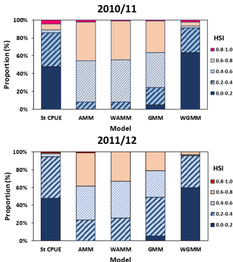
شکل ۲. توزیع نسبت نقاط ماهیگیری متعلق به طبقات شاخص مطلوبیت زیستگاهی و همچنین مقادیر استاندارد شده صید در واحد تلاش صیادی در فصول صید ۲۰۱۰/۱۱ و ۲۰۱۱/۱۲. (stCPUE) صید در واحد تلاش استاندارد شده؛ AMM: مدل میانگین حسابی؛ GMM: مدل میانگین هندسی؛ WAMM: مدل میانگین حسابی وزن‌دهی شده؛ WGMM: مدل میانگین هندسی وزن‌دهی شده)